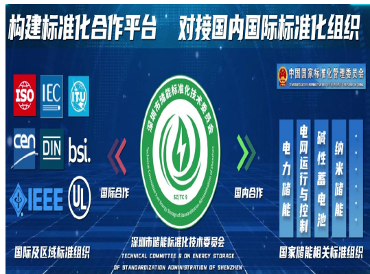
INDUSTRY STANDARD RELEASE