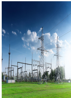
ELECTRIC POWER SYSTEM

Build 50,000 square meters of exhibition area