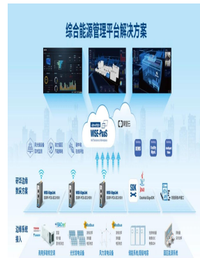
COMPREHENSIVE ENERGY SERVICE